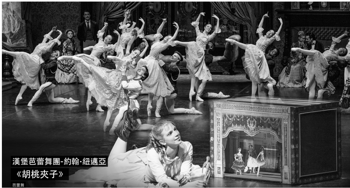
漢堡芭蕾舞團-約翰·紐邁亞