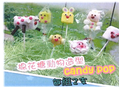
棉花糖動物 CANDY POP