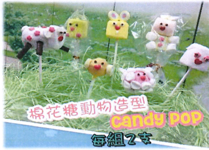
棉花糖動物 CANDY POP